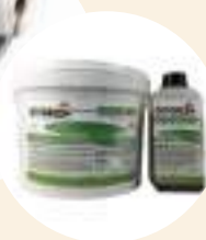
FASCE PER INCOLLAGGIO OPPURE GEOCOLLA